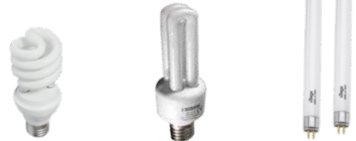
espiral en forma de U lineales

Los más comunes son los que normalmente llamamos fluorescentes y pueden ser: