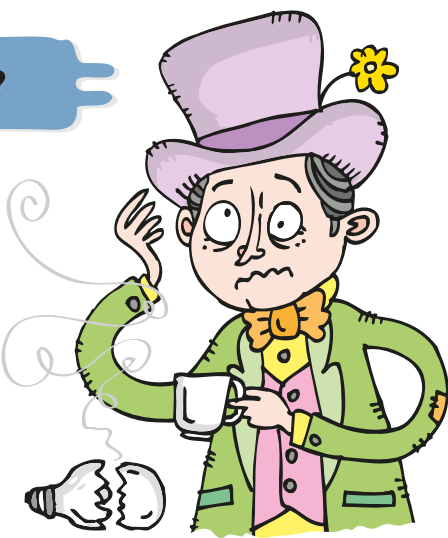
El personaje de "El sombrero loco" en Alicia en el país de las maravillas se inspira en los fabricantes de sombreros del siglo XIX quienes estaban expuestos al mercurio utilizado para la fabricación de sombreros de fieltro.

El mercurio puede dañar la salud humana ya que es tóxico al sistema nervioso, el cerebro y la médula. Sus efectos pueden ser sutiles. Los adultos que han estado expuestos a altas cantidades de mercurio pueden empezar a experimentar temblor en las manos, adormecimiento y hormigueo en los labios y dedos. Otros efectos pueden incluir fatiga, dolor en las coyunturas e inestabilidad mental. Estos efectos pueden empezar mucho después de que se estuvo expuesto al tóxico.