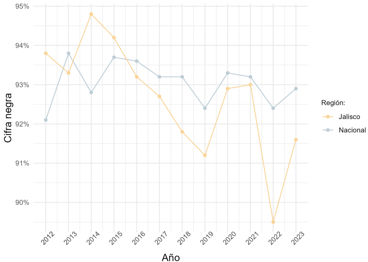
Gráfico II. Cifra negra, Jalisco vs. Nacional (2012 – 2023)