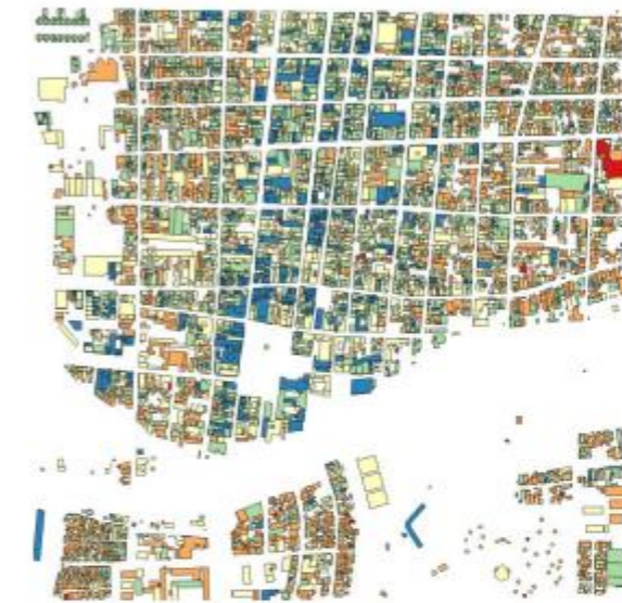
Metodologías para el procesado de datos Lidar