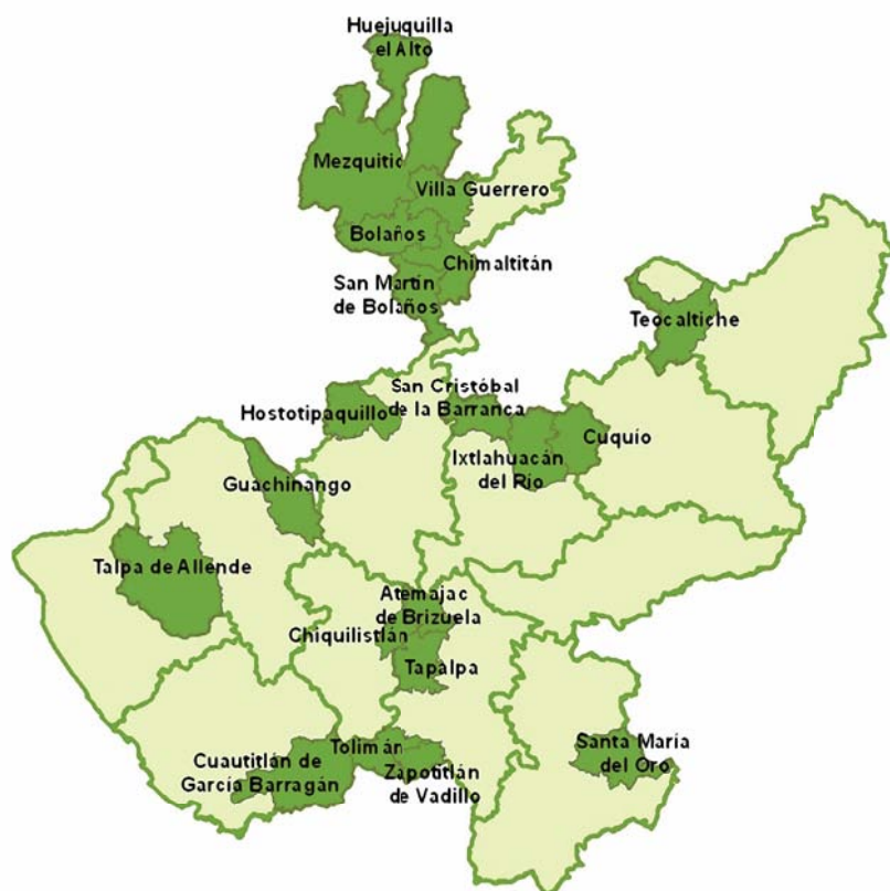
Figura 4.4 Los veinte municipios con el Índice de Pobreza por Ingresos más alto.

En la figura 4.4 se observa la distribución de los municipios con los mayores índices de pobreza por ingresos. Se aprecia que la región Norte concentra seis municipios, la región Sur cuatro, la región Centro tres, la Sierra Occidental dos; por su parte en las regiones Sur, Costa Sur, Sierra de Amula, Valles y Altos Norte encontramos un municipio por cada región.