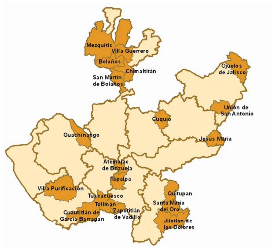
Figura 4.1 Los veinte municipios con el IDH más bajo.