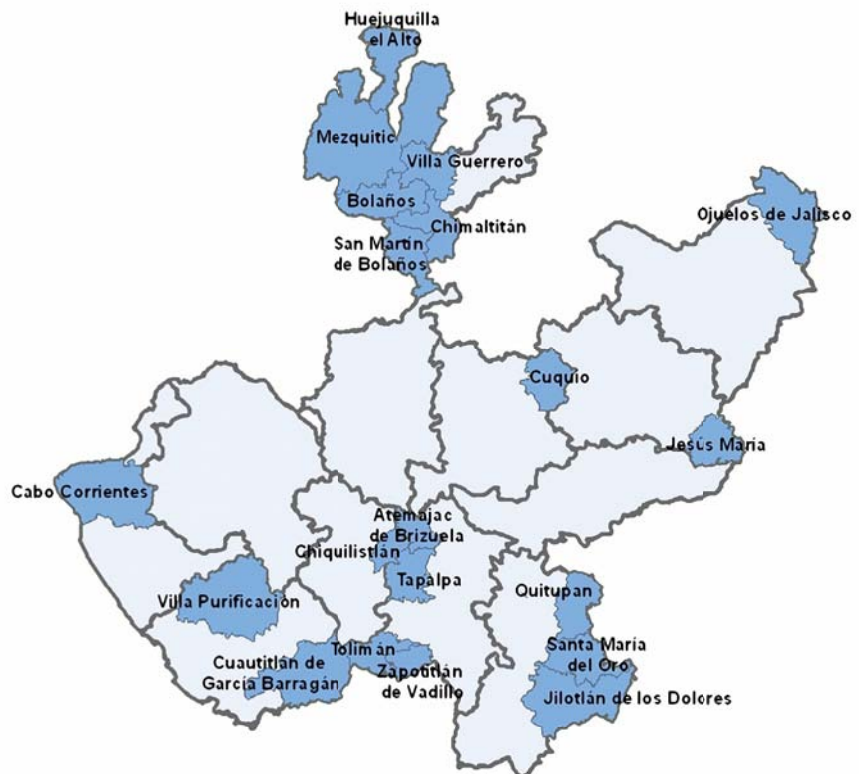
Figura 4.3 Los veinte municipios con el IRS más alto.

En la figura 4.3 se muestra la localización de los veinte municipios de la tabla 4.6, se puede observar seis municipios se encuentran localizados en la región Norte, por su parte cuatro municipios se localizan en la región Sur, la región Sureste aglutina otros tres municipios, dos municipios más se encuentran en la región Costa Sur, finalmente cinco regiones concentran un municipio cada una, la región Centro, Sierra de Amula, Altos Norte, Altos Sur y Costa Norte.