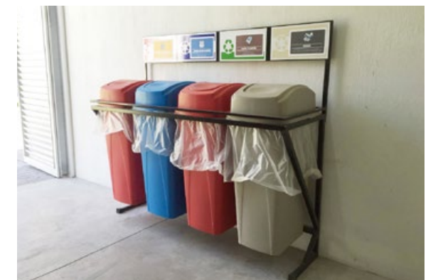
• Respetuoso con el medio ambiente.