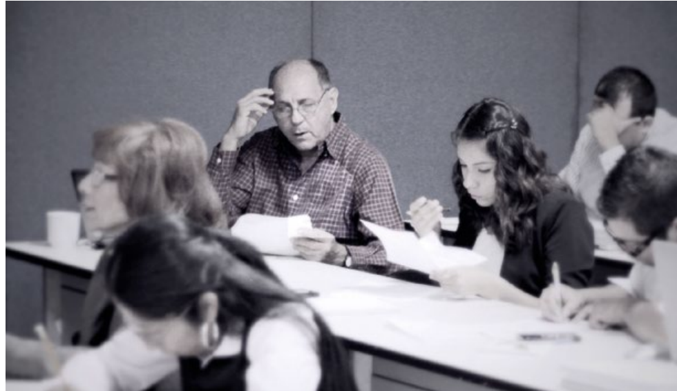
• Taller realizado en el marco del Acuerdo de Cooperación Técnica con Banco Mundial e INEGI.