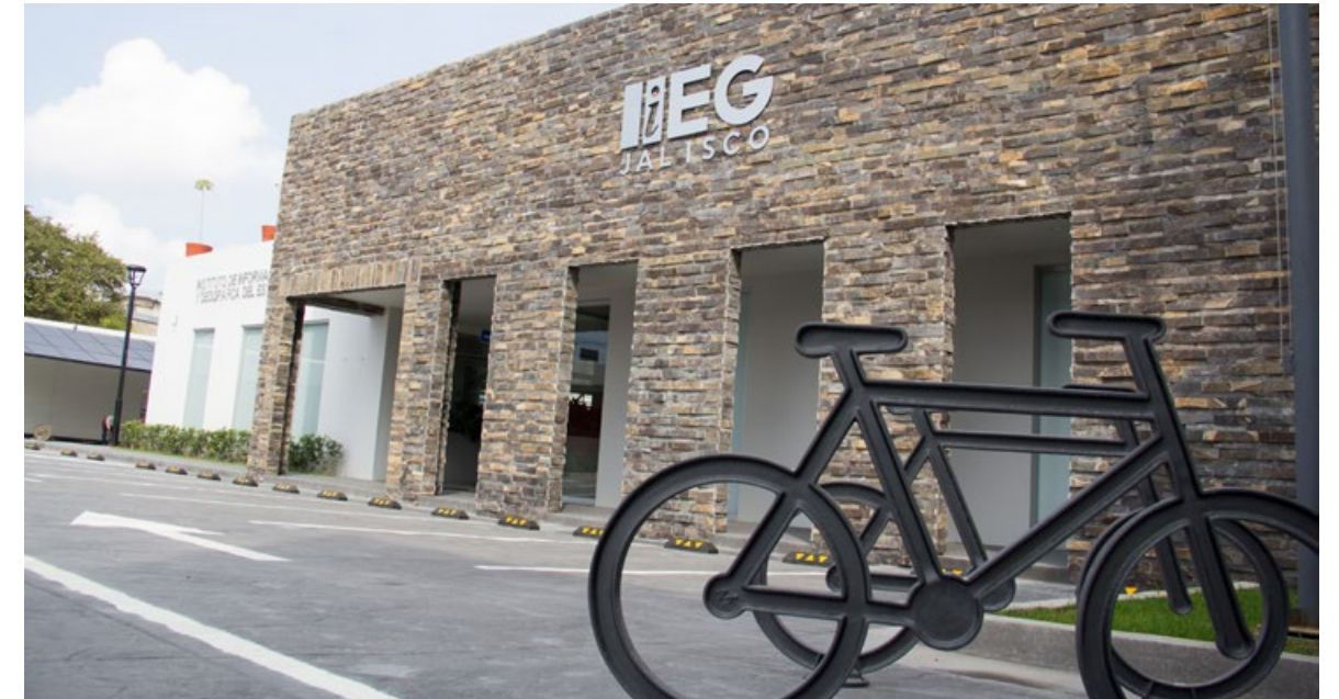
• Fachada de la nueva sede del IIEG.

El IIEG ocupó tres sedes de manera provisional durante la mayor parte de los 18 meses que llevó la construcción del nuevo edificio en la finca del fusionado Instituto de Información Territorial, ubicado en la colinia Ciudad Granja en el municipio de Zapopan.