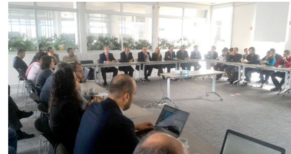
• Primera Sesión Ordinaria 2016 del Comité Estatal de Información Estadística y Geográfica (CEIEG) Jalisco.

El Comité Estatal de Información Estadística y Geográfica del Estado de Jalisco (CEIEG) es una instancia colegiada de participación y consulta conformado, en su mayoría, por las dependencias estatales con el fin de agrupar la información que se genera en cada una de ellas, útil para los decisores técnicos y estratégicos.