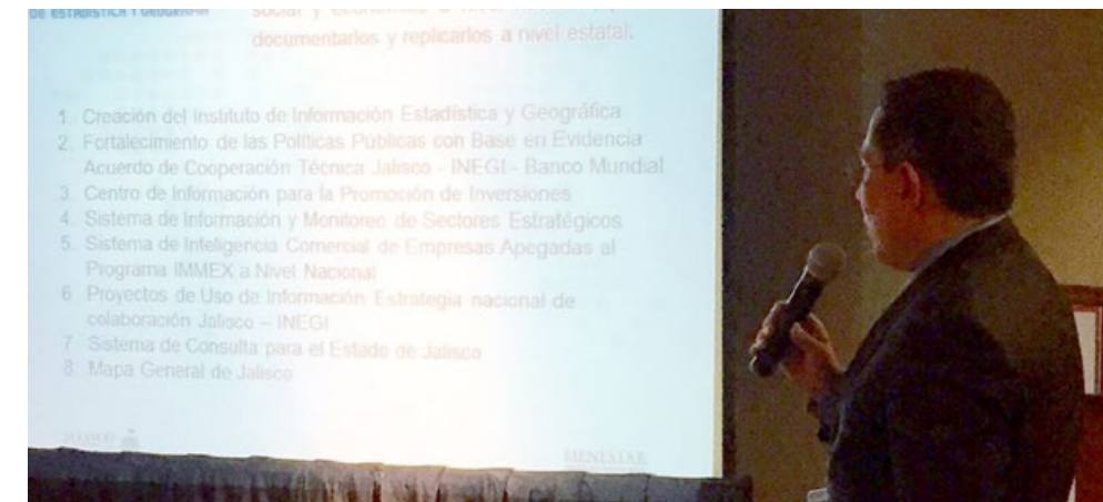
• Exposición de los casos de éxito del IIEG dentro de el Foro Geoespacial Latinoamericano 2015.

Se participó en respuesta a la invitación directa del INEGI para exponer los casos de éxito en materia de información geoestadística en el Latin American Geospatial Forum, Fortaleciendo la Colaboración Geoespacial para el Desarrollo Sustentable, realizado en la Ciudad de México del 10 al 12 de noviembre.