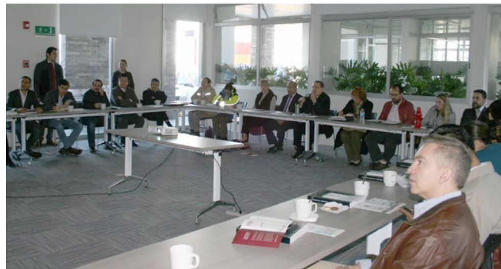
• Presentación del Plan Anual de Trabajo 2016 durante la segunda reunión ordinaria.

El CEIEG sesionó en tres reuniones de trabajo durante el 2015: