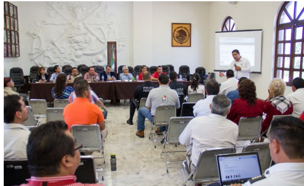
• Presentación del Atlas de Peligros y de Riesgos. Sistema de Información Geográfica para el municipio de Zapotlán el Grande.

Generación o integración de información de riesgos, planeación urbana, catastro y ordenamiento ecológico para su sistematización en un SIG de desarrollo propio en materia de mejora regulatoria.