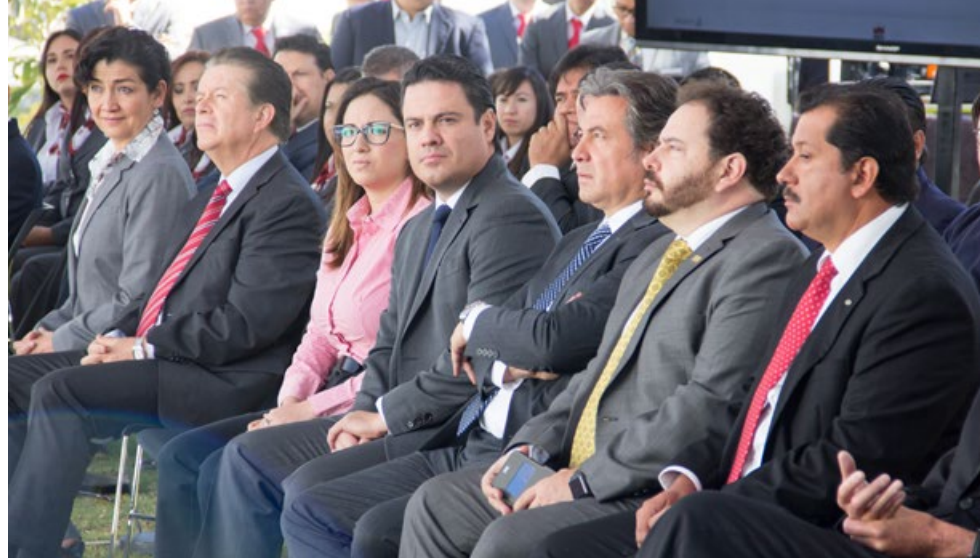
• El C. Gobernador Jorge Aristóteles Sandoval encabezó el protocolo inaugural de la nueva sede.

Si bien la inauguración estaba programada para finales del 2015, la fecha fue diferida para que fuese el C. Gobernador Constitucional del Estado de Jalisco, Mtro. Jorge Aristóteles Sandoval Díaz, quien encabezara el protocolo inaugural, lo que ocurrió el 18 de enero de 2016. En la sede definitiva del Instituto de Información Estadística y Geográfica, se concentra ahora la información sociodemográfica, económico financiera y geográfico ambiental de la entidad.