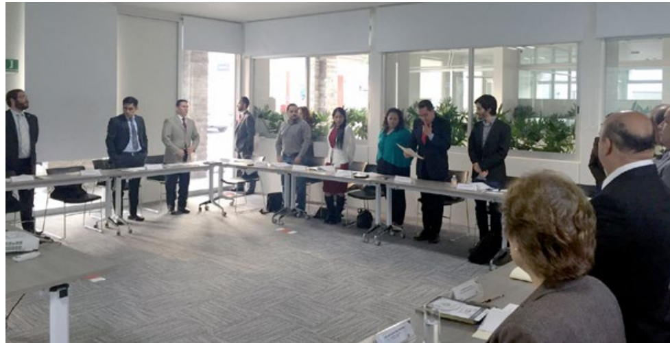
• Sesión de instalación del Consejo Consultivo del IIEG.

El 3 de diciembre del año 2015 se instaló el Consejo Consultivo del Instituto de Información Estadística y Geográfica del Estado de Jalisco, con las siguientes instituciones que lo conforman: