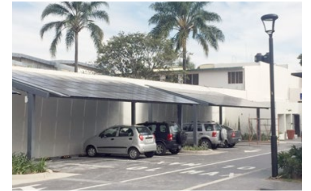
• Paneles solares.