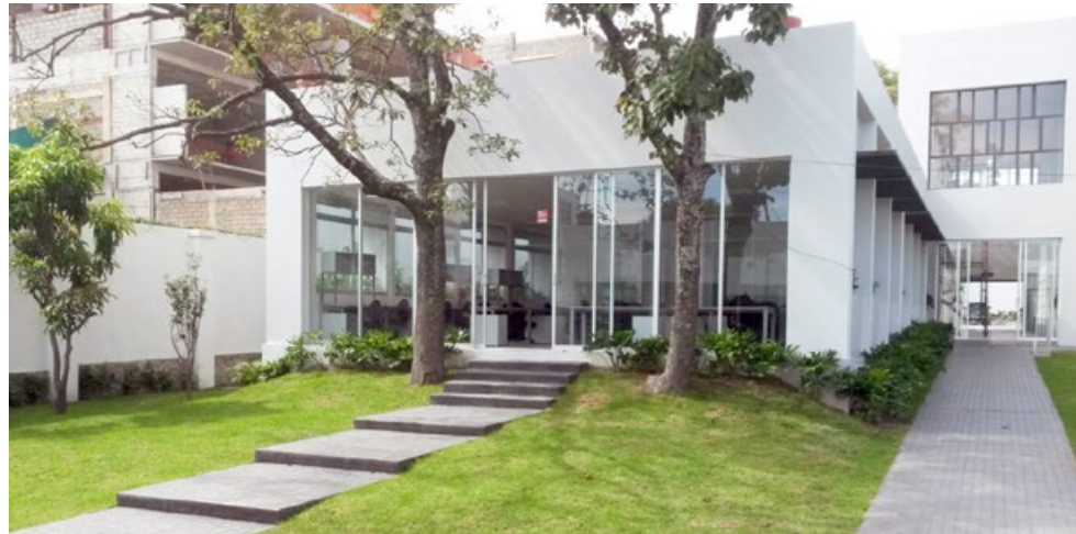
• Se invirtieron 42 millones de pesos, en su mayoría aportados por el propio Instituto.

La inversión total fue de 42 millones de pesos en su mayoría aportados por el propio Instituto. El terreno, cuenta con una superficie de 4,318 metros cuadrados y fue valuado en 15 millones de pesos. En la construcción se invirtieron 27 millones de pesos, 7.5 de ellos aportados por el Gobierno del Estado y el resto por el Instituto.