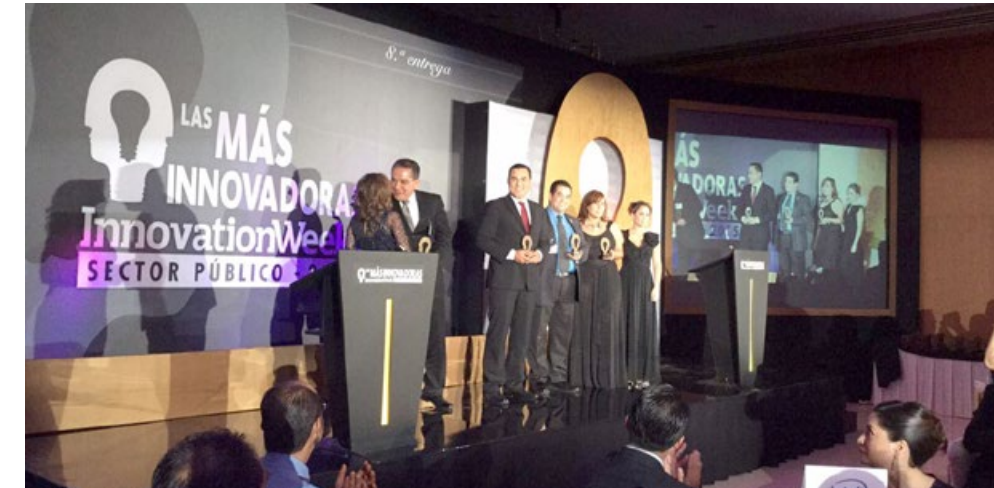
• Entrega de reconocimiento a la plataforma IMMEX en la 8ª entrega de premios a "Las más innovadoras del sector público" de InnovationWeek México.

Durante octubre, nueve proyectos jaliscienses fueron reconocidos por la revista especializada líder en tecnologías de negocios Innovation Week de NetmediaResearch, colocándolos en el ranking de las "Más Innovadoras del Sector Público"; entre ellos, se reconoció al Instituto de Información Estadística y Geográfica por la plataforma IMMEX.