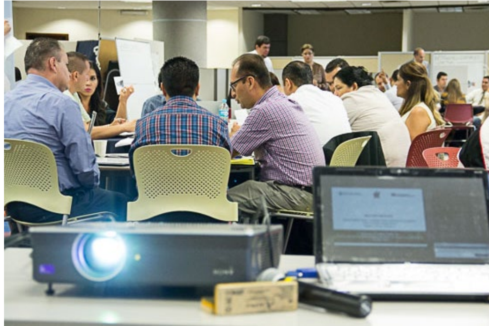
• Taller "Fortalecimiento del Sistema de Información Estratégica del Estado de Jalisco y sus Municipios" en el Tecnológico de Monterrey Campus Guadalajara.

Se han recibido varios documentos relativos a los dos primeros puntos de la cooperación, como resultado de la evaluación de la oferta y demanda de información estadística; las tecnologías de información; el nivel de preparación para datos abiertos; el estado de la información geográfica y sus usos potenciales. Los reportes completos están disponibles en la página Web de IIEG ( www.iieg.gob.mx/proyectosiieginegi ).