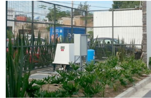
• Planta de tratamiento de agua.