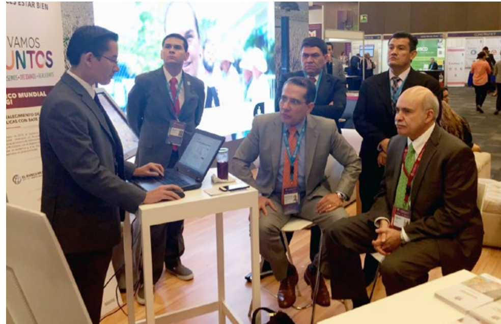
• Presentación de los productos de información del IIEG al entonces presidente del INEGI, Dr. Eduardo Sojo Garza Aldape, durante el 5° Foro Mundial de la OCDE.

La OCDE destacó el enfoque en el bienestar que el Gobierno del Estado ha dado a sus políticas públicas. Así mismo, quedó de manifiesto el esfuerzo de Jalisco por mejorar las políticas públicas en nuestro país a través de información de calidad, para lo cual ha resultado evidente el rol de liderazgo que ha asumido el IIEG a nivel nacional.