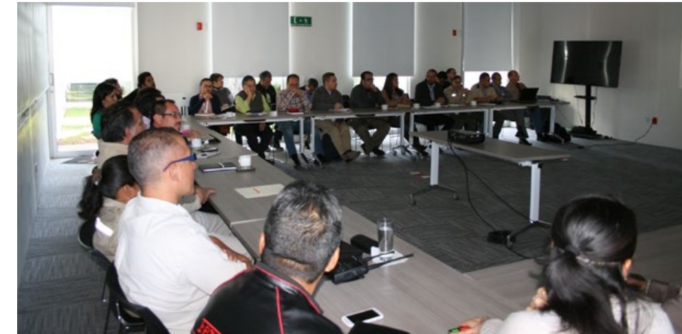
• Instalación del Subcomité de Información de Geografía y Medio Ambiente.

Mientras que el 15 de marzo pasado fue la primera reunión ordinaria del año 2016. Previo a esta reunión, quedaron instalados los cuatro subcomités de información con los que se trabajará a partir de esa fecha: