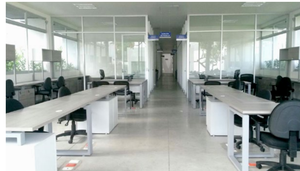
• El edificio es moderno, agradable e incluyente, con la tecnología adecuada para brindar un mejor servicio.

De esta manera se concreta la integración de los recursos tanto materiales como humanos del Instituto, se cuenta con la infraestructura para el óptimo desempeño del personal y para brindar un mejor servicio a los usuarios y visitantes, y proveer tanto al sector público como al privado de información estratégica de calidad.