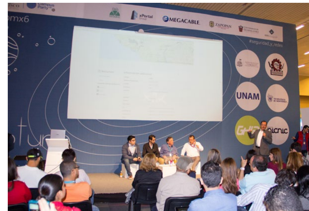
• Presentación del portal de datos abiertos en el marco del evento Jalisco CampusParty .

Durante el Campus Party 2015 se presentó el portal datos.jalisco.gob.mx con 104 data sets generados por instituciones gubernamentales, en formatos abiertos para ser usados y redistribuidos de forma libre. El portal desarrollado en coordinación con la Dirección General de Tecnologías de Información del Gobierno del Estado cuenta con 112 data sets liberados, de los cuales 64 corresponden a la información liberada por el Instituto.