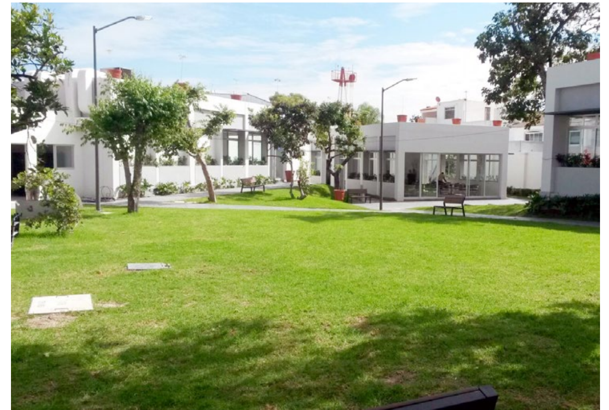
• Amplios jardines.