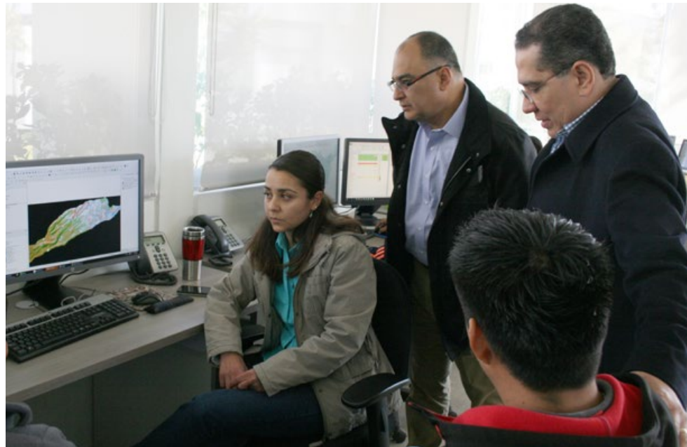
• Visita del Mtro. Rolando Ocampo Alcántar, Vicepresidente de Información Geográfica y del Medio Ambiente de INEGI.

Lo anterior se ha visto reflejado de manera concreta en acciones determinantes tales como la formalización del Centro de Información Estadística y Geográfica del Estado de Jalisco. El 7 de septiembre del 2015 se firmó con la Dirección Regional Occidente de INEGI el convenio de colaboración para la creación y operación de dicho Centro que, desde entonces, viene operando a cargo del IIEG.