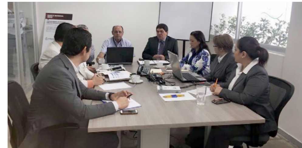
• Instalación del Subcomité de información de Gobierno Seguridad y Justicia.