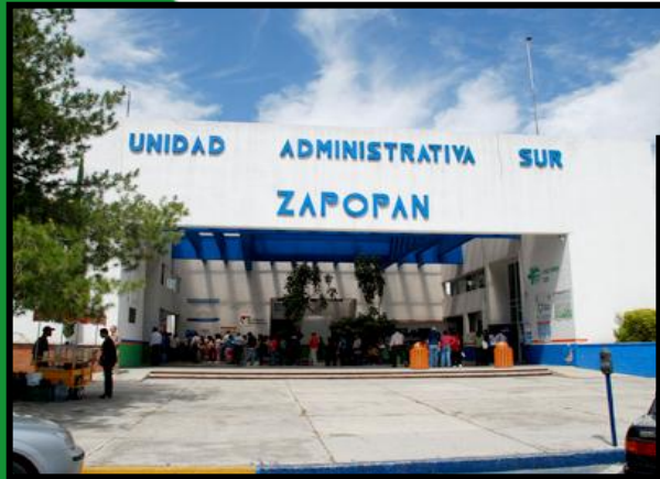
CRUZ VERDE SUR