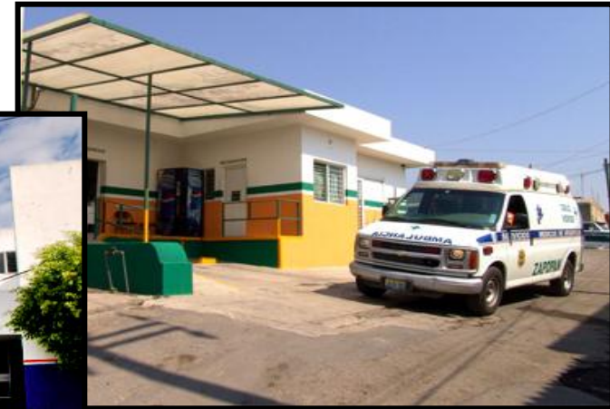
CRUZ VILLAS DE GPE.