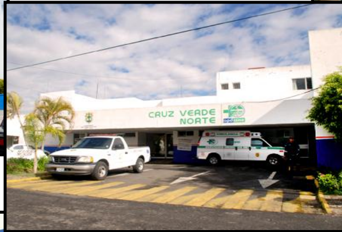
CRUZ VERDE NORTE