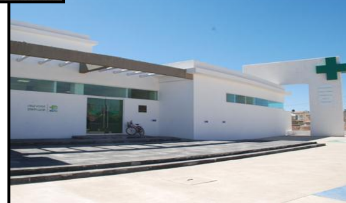
CRUZ VERDE STA. LUCIA