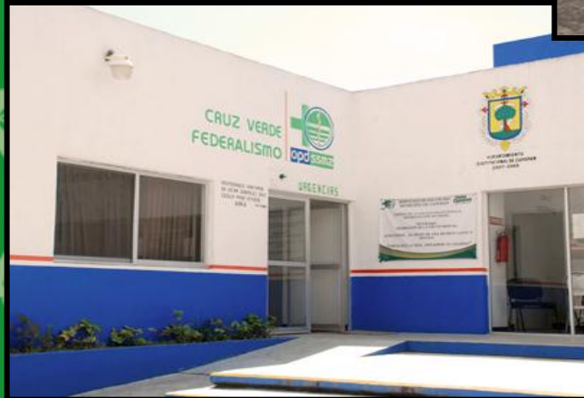
CRUZ VERDE FEDERALISMO